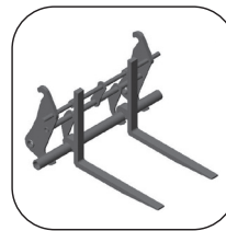
Forks Mounted on Quick Coupler